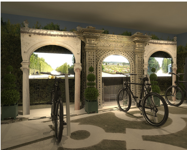
Visite interactive des jardins à l'aide de vélos connectés

En exclusivité pour le château de Versailles et pour cette exposition Virtually Versailles , le Maître parfumeur Francis Kurkdjian a créé Royal délice . Ce parfum unique, inspiré par la fleur préférée du Roi Soleil révèle une fleur d'oranger fabuleuse, complétant cette expérience immersive avec une dimension sensorielle rarement explorée dans des événements culturels.